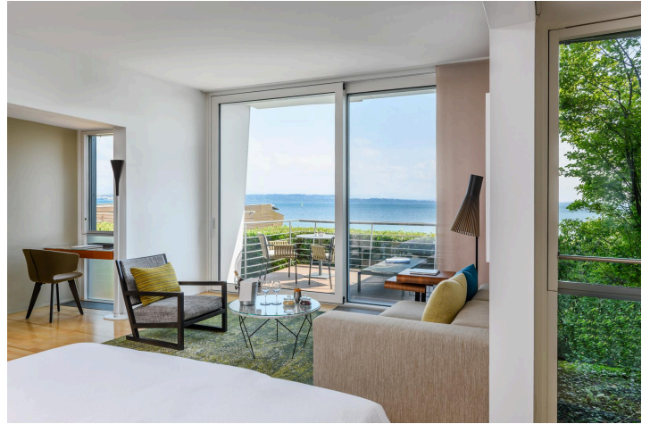
Pavillon Rivage