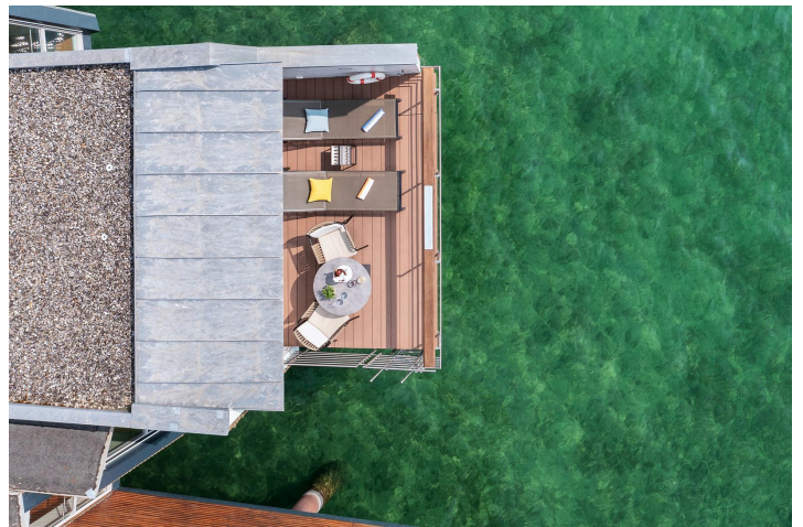
Pavillon Lacustre