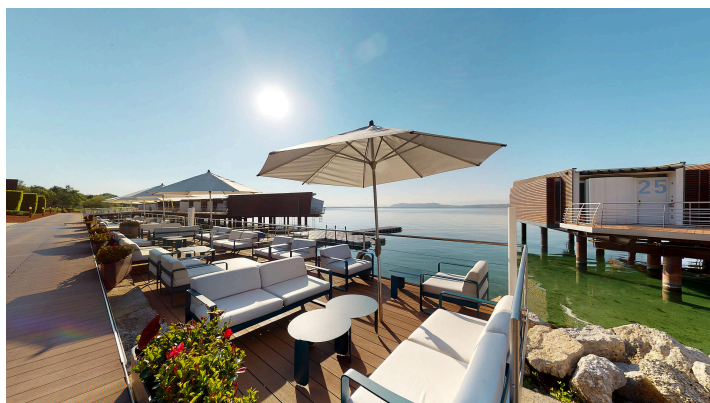
La Table de Palafitte – Terrasse Summer Day